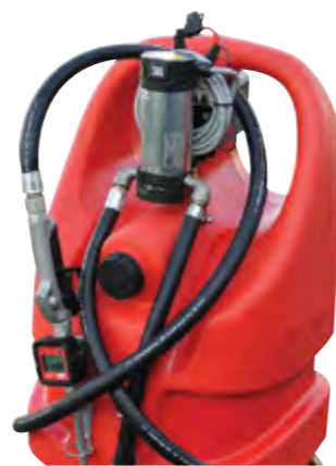
Версия для масла. Available for lubricants.

[EN] Polyethylene tank for Fuels (Gasoline, Diesel Fuel) transport, homologated in accordance with ADR regulations.