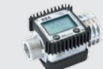
Код / COD. CLTK24ATEX

Цифровой счётчик модель M24 для дизельного топлива. Digital fuel meter, mod. M24, for Diesel Fuel.