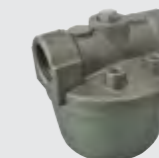
Код / COD. FLT60MB

Фильтр Топливный фильтр с фильтрующим сетчатым элементом из нержавеющей стали INOX, 60 мкм, алюминиевый корпус.