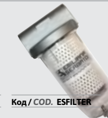
Код / COD. ESFILTER

Strainer Strainer filter, stainless steel filtering element 60 µm, aluminium bowl and head. Only with DC pump max. flow rate 40 l/m.