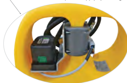
Версия с питанием от перезарядной батареи. Available with power supply by rechargeable battery.

* За сведениями о других транспортируемых материалах, принадлежащих к допустимым классам и группам упаковки, обратитесь к компании Emiliana Serbatto. For other transportable materials belonging to Classes and Packaging Groups allowed, ask to Emiliana Serbatto.