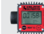
Код / COD. CTLM24

Strainer Cartridge filter with removable filtering element 60 µm, aluminium bowl and head. Only with DC pump max. flow rate 40 l/m.