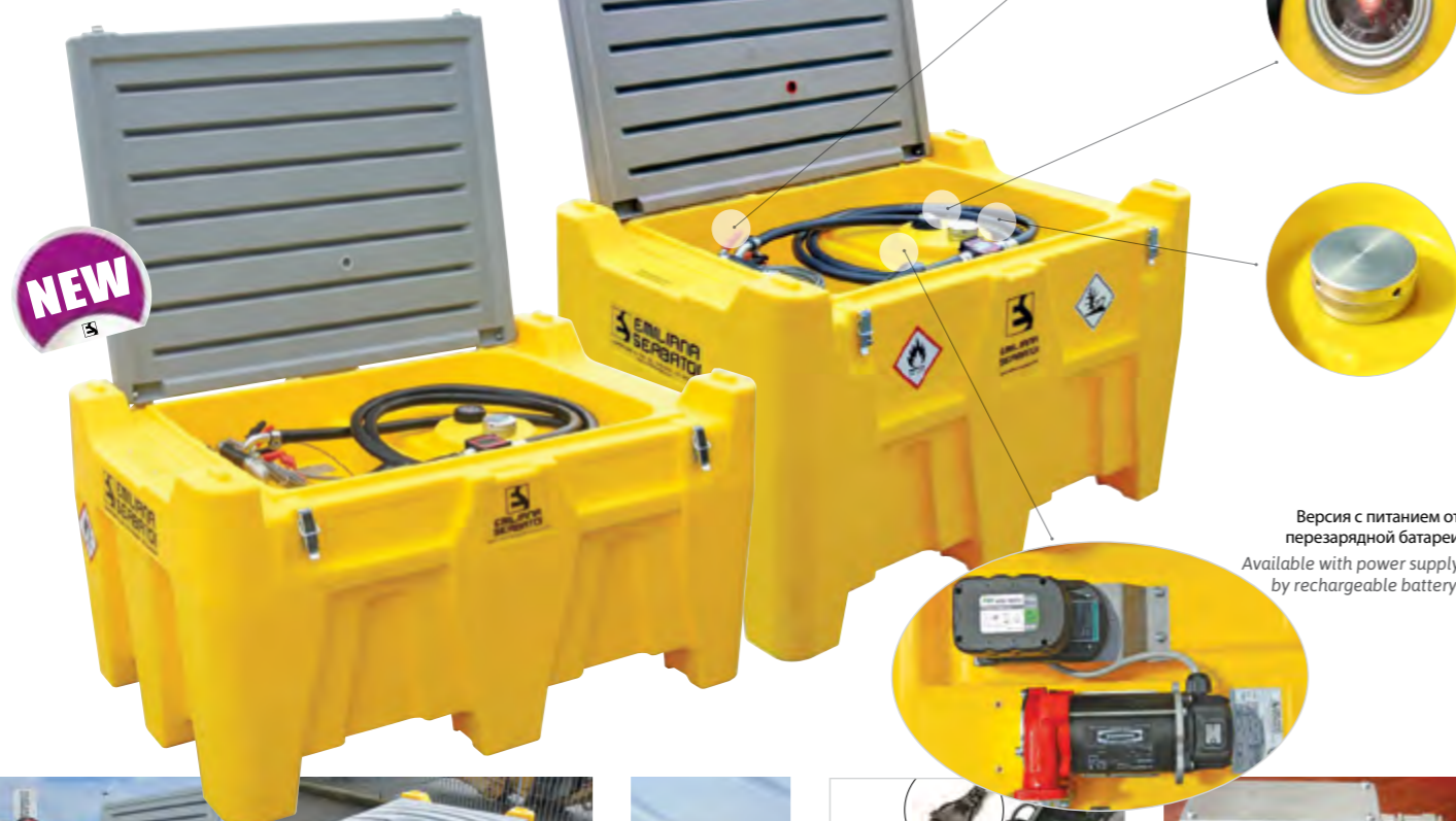
Версия с питанием от перезарядной батареи Available with power supply by rechargeable battery.

[EN] Polyethylene tank for fuel transport, in exemption from ADR according to paragraph 1.1.3.1.C.